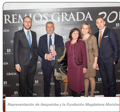
Representación de Aexpainba y la Fundación Magdalena Moriche