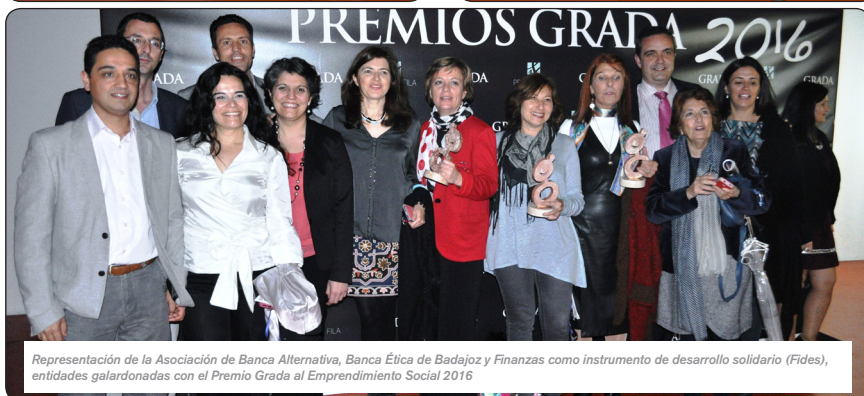
Representación de la Asociación de Banca Alternativa, Banca Ética de Badajoz y Finanzas como instrumento de desarrollo solidario (Fides), entidades galardonadas con el Premio Grada al Emprendimiento Social 2016