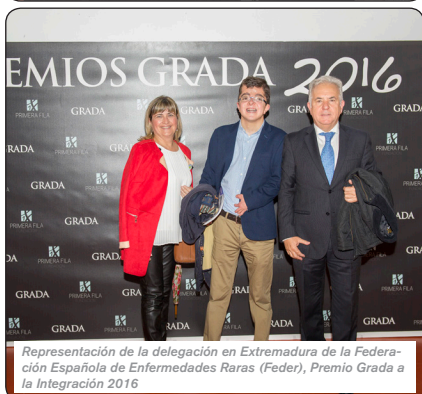
Representación de la delegación en Extremadura de la Federación Española de Enfermedades Raras (Feder), Premio Grada a la Integración 2016