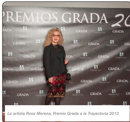
La artista Rosa Morena, Premio Grada a la Trayectoria 2013